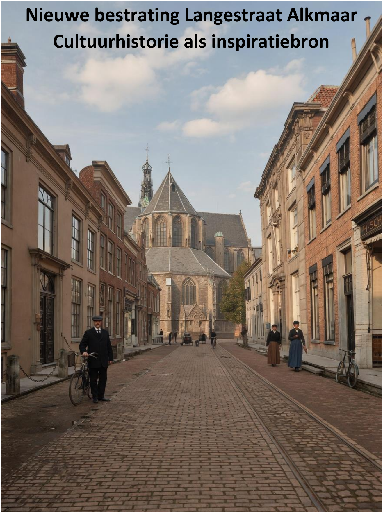
Fotobijlage bij Advies Historische Vereniging Alkmaar inzake de herbestrating van de Langestraat