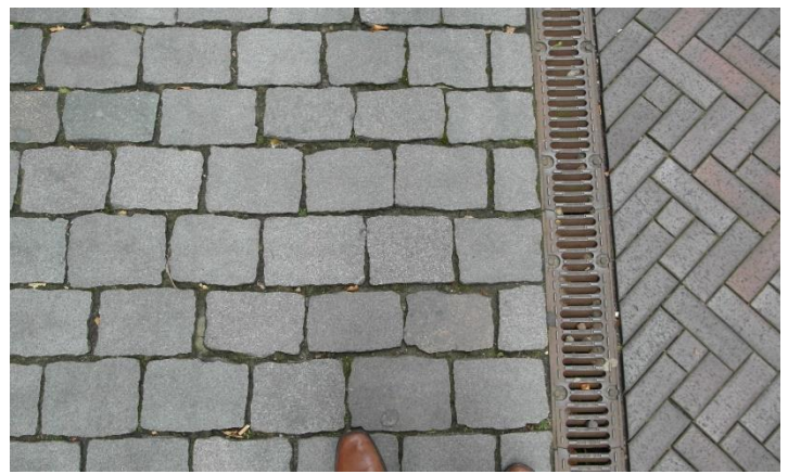
Foto 18 voorbeeld bestrating in beschermd stadsgezicht Bergen op Zoom