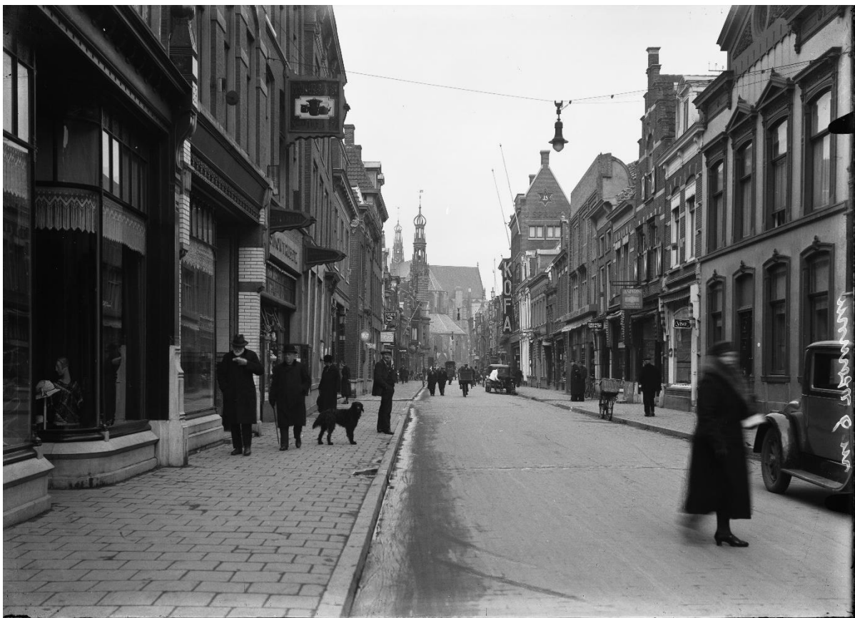
Foto 4 In 1926 kreeg de Langestraat een rijweg van asfalt en een breed trottoir van betontegels waarbij de stoepen per pand geruimd zijn.