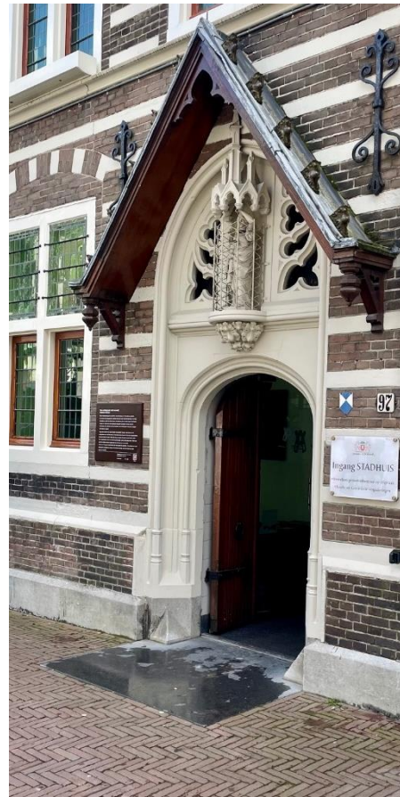
Foto 20 en 21 Hardstenen stoepen bij het stadhuis