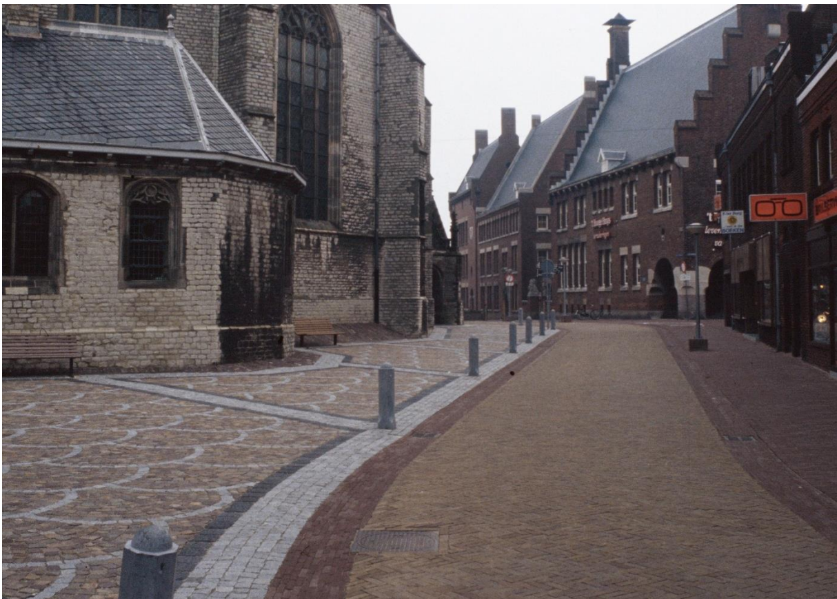
Foto 14. Bij de Koorstraat is geen genuanceerde bestrating aangebracht maar is het verschil tussen gele en rode steen gebruikt om de doorgaande rijweg te markeren; goed aansluitend op de sierbestrating rond de Grote Kerk