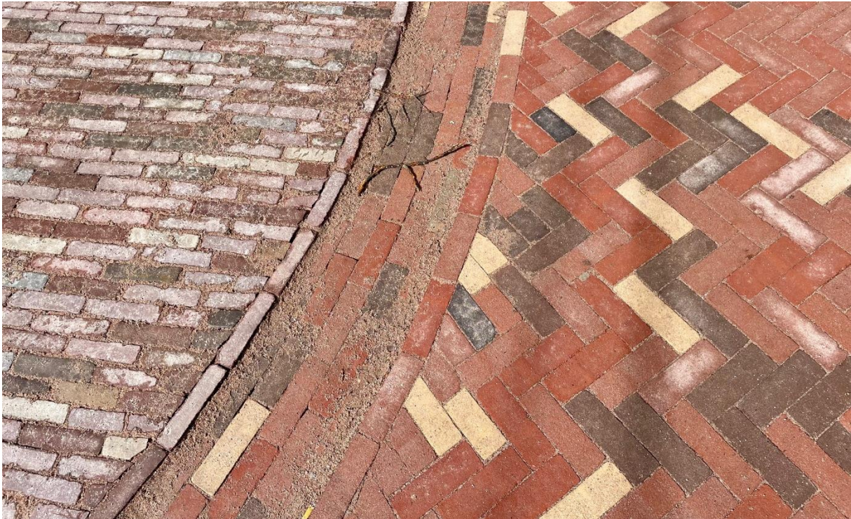
Foto 13 Straatklinkers volgens richtlijn 'Alkmaars genuanceerd'; met bestaande klinkers is dat prima, maar bij nieuwe stenen zijn de kleunen te contrastrijk waardoor verrommeling van het straatbeeld ontstaat.