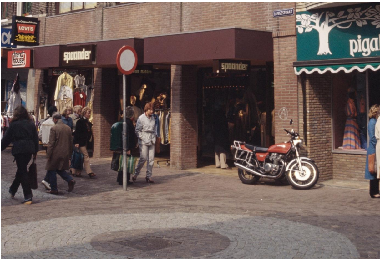
Foto 7 Verbijzonderingen in de bestrating bij zijstraten zoals hier bij de Pastoorsteeg ca 1985