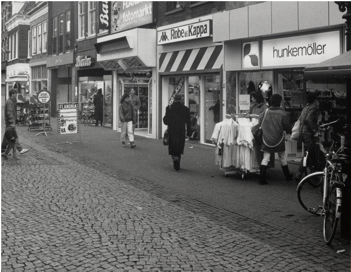
Foto 5 De eerste bestrating van de Langestraat als wandelpromenade vanaf 1980