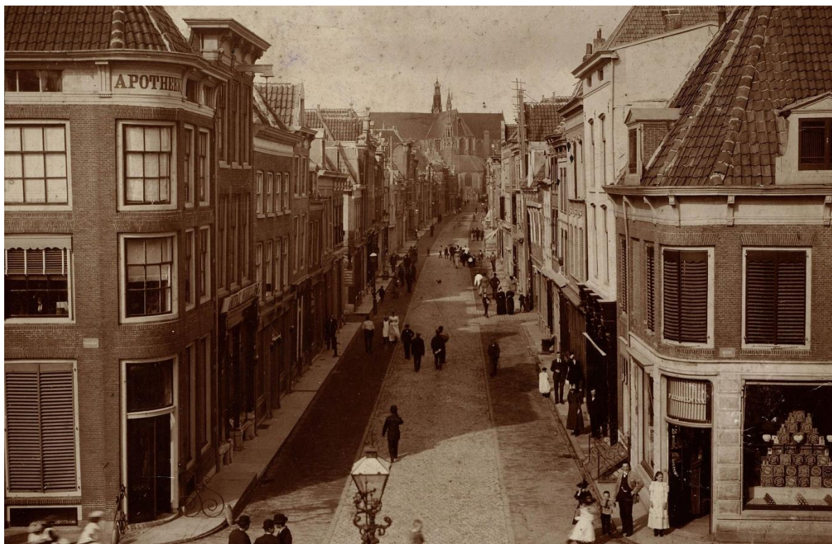
Foto 2 De Langestraat gezien vanaf de Mient in ca 1890. De bestrating is in bijna 100 jaar tijd niet gewijzigd