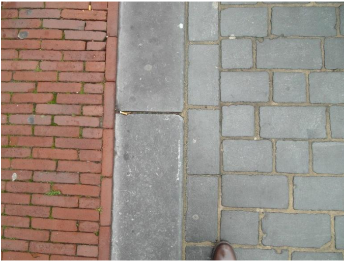
Foto 15 voorbeeld bestrating in beschermd stadsgezicht Zwolle