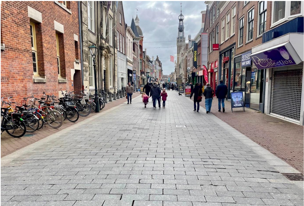
Foto 10 de huidige sierbestrating zoals die in 2016 is aangelegd met natuursteen tegels van 20 x 40 cm.