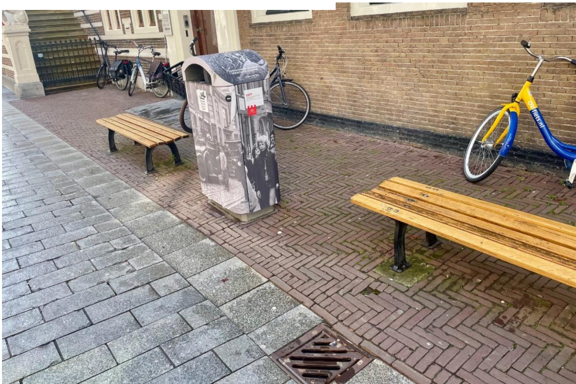
Foto 22 Bankjes op de klinkerbestrating strook voor het stadhuis en een afvalbak met historische foto's