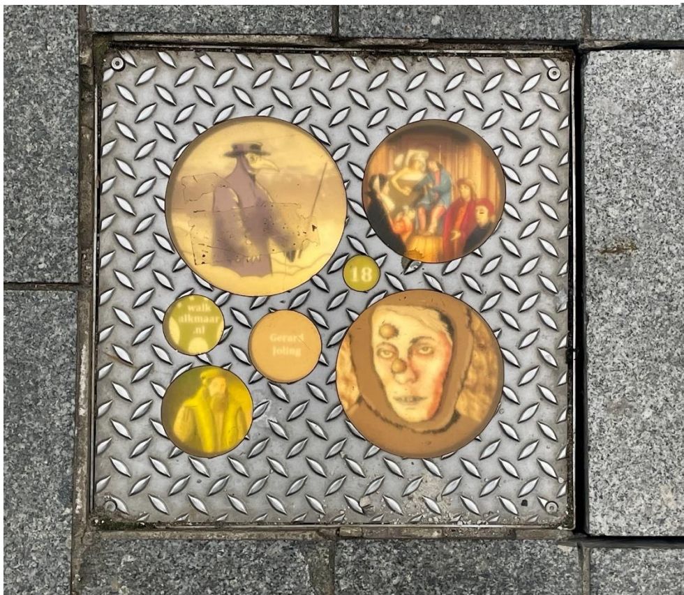
Foto 12: Elke tegel (40x40 cm) van de Walk of History heeft een thema en er staat klein vermeld wie de schenker was (crowdfunding actie).