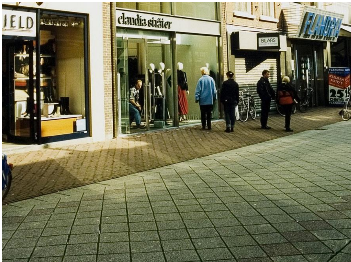
Foto 8 Bestrating met een middenstrook van tegels die er 1996 tot ca 2015 heeft gelegen