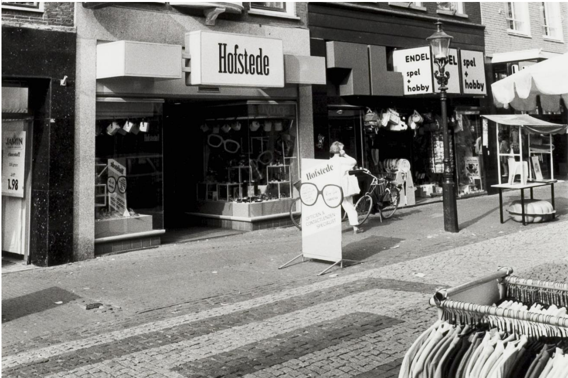
Foto 6 De keitjes bestrating van de 80er jaren had op sommige plaatst verbijzonderingen door kleuren en legpatroon