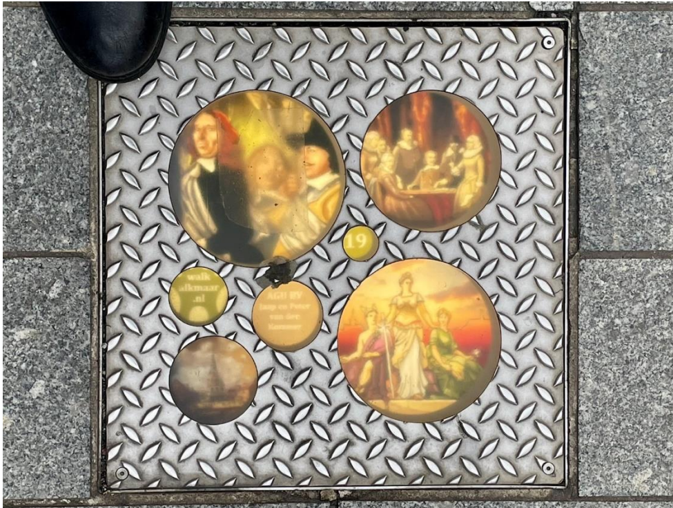
Foto 11 Voorbeeld metalen tegel met lichtbeelden van de "Walk of History"