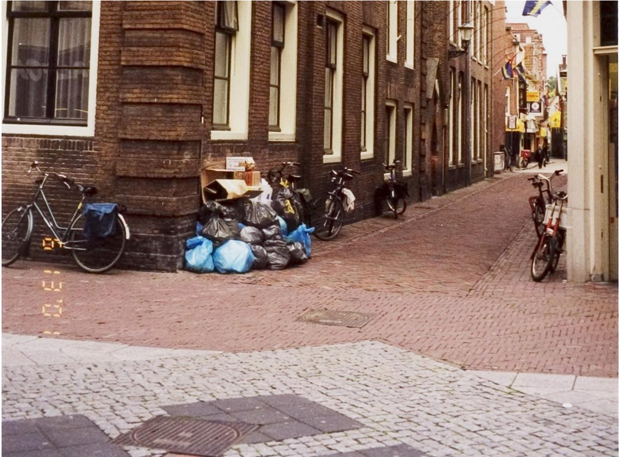
Foto 9 Ook bij de tegelbestrating waren er op enkele plekken zoals bij zijstraten verbijzonderingen in het bestratingspatroon