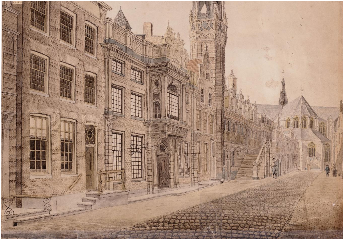
Foto 1 Tekening van J.A. Crescent van rond 1800. De huizen aan de Langestraat hadden stoepen en de bestrating bestond uit een middenbaan van kasseien (kinderhoofdjes) en tussen de middenbaan en de stoepen was er een strook met gebakken klinkers.