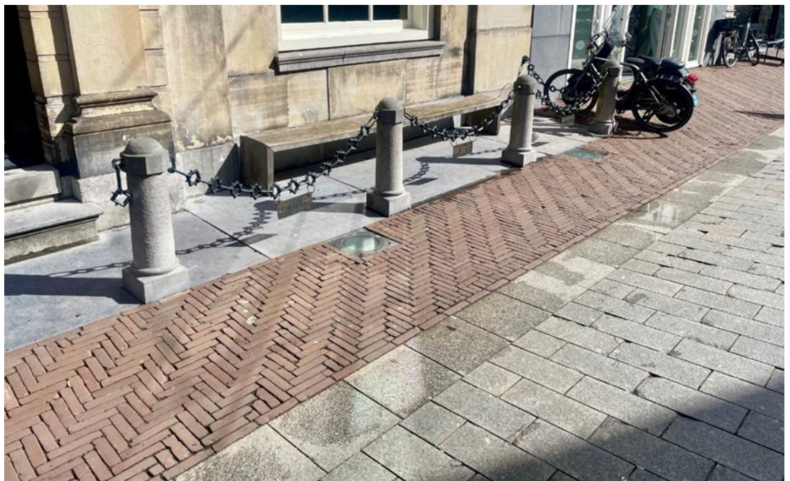
Foto 19 Hardstenen stoep bij Huize De Dieu. Tussen de en klinkerbestrating in visgraadverband en de middenbaan ligt een kolk voor regenwater met hardstenen tegels van 40x 40 cm