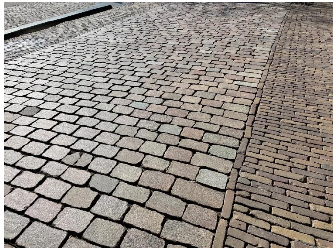
Foto 16 voorbeeld bestrating in beschermd stadsgezicht Dordrecht