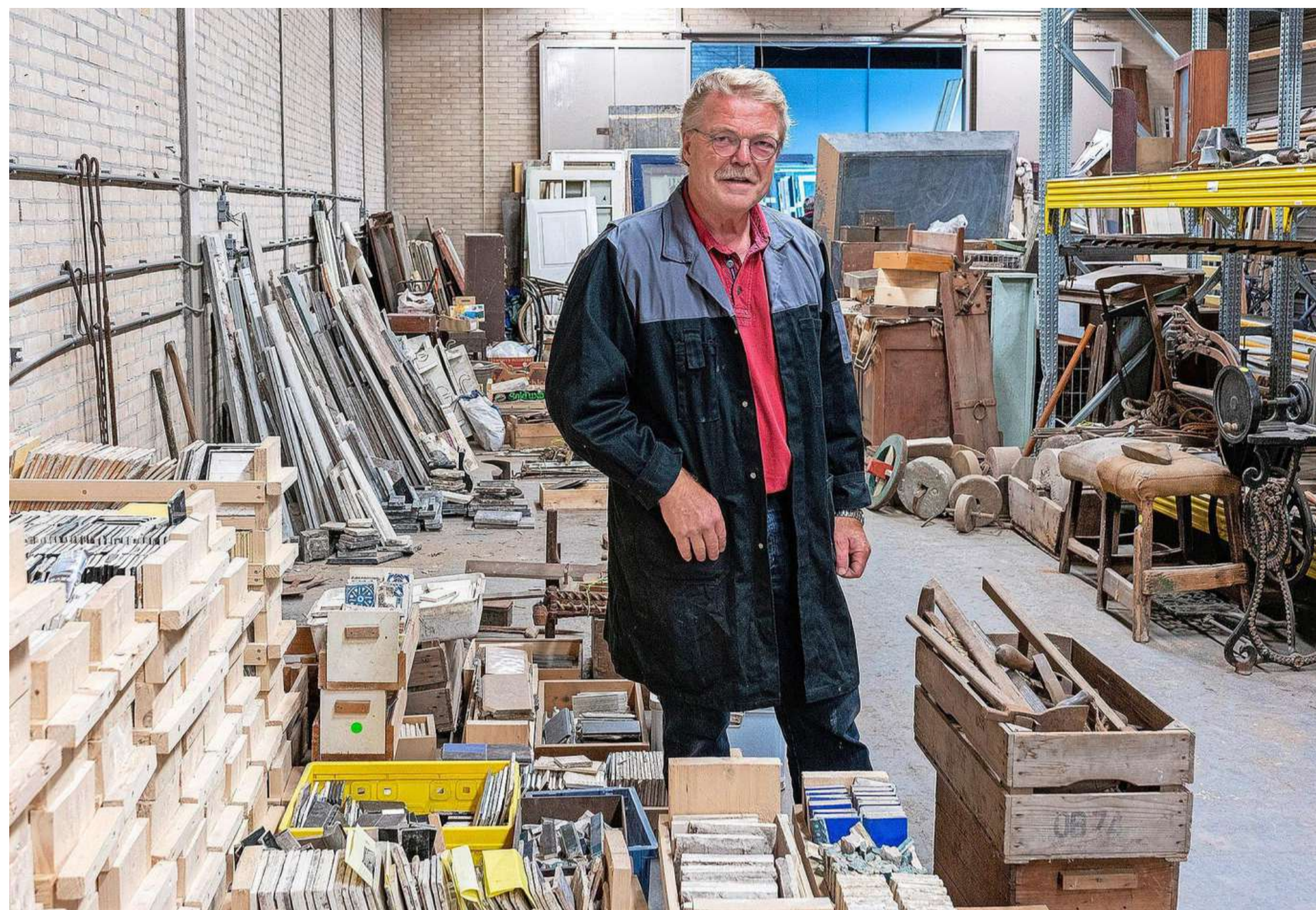
„Wanneer wordt er echt gebouwd? Ze kunnen toch eerst de Kanaalzone volbouwen? Hoe snel zouden ze zijn? Ik zei wel drie jaar, maar misschien zijn het er tien.”

Het is aan de gemeente om een plekje te gunnen. Zelf iets vinden, lukt niet. „Ik kan dat niet overzien.” Hij weet alleen dat het Stedelijk Museum geen ruimte voor opslag heeft.