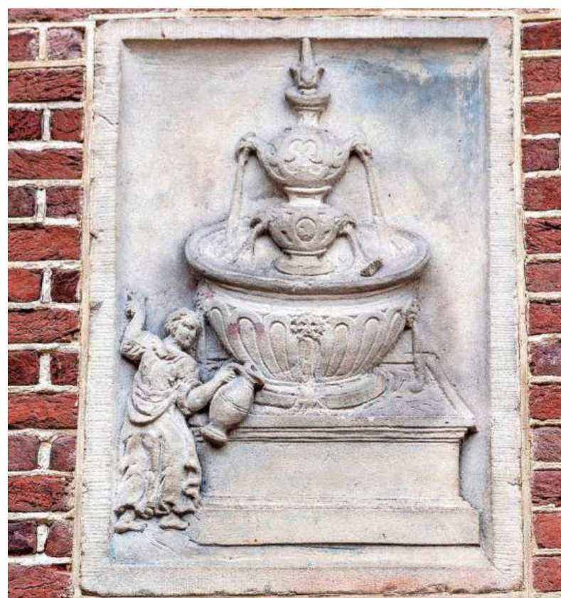
De 170 jaar oude gevelsteen kreeg een plek aan de Remonstrantse Kerk.

„ Er is niets zwart op wit, dat zouden wij wel willen. Hoe lang hebben we nog? Een jaar of drie of vier?”