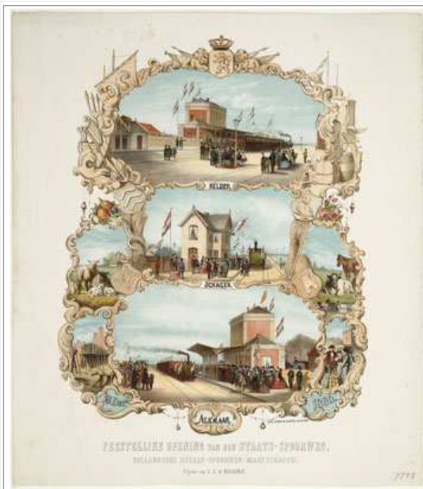
bron 8 Opening van de spoorlijn Den Helder - Schagen - Alkmaar op 18 dec 1865. Het nieuwe station ligt een eind van de stad, nog midden in de weilanden.