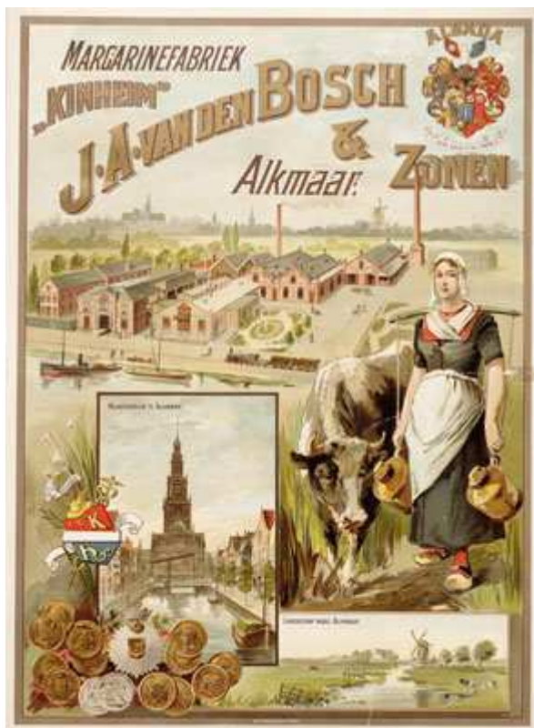
bron 17 Reclameposter van de stoommargarinefabriek Kinheim

Gebruik bron 16 c Maak een bijschrift bij de foto waarin een juiste samenvatting staat van de (omvang/het balng van) de industrialisatie in Alkmaar.