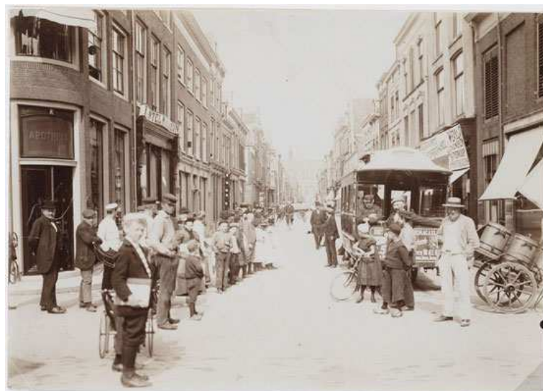
bron 9 Paardentram van de Stenenbrug naar het station (via de Langestraat) Om bij de Stenenbrug te keren moesten de paarden worden uitgespannen. Foto uit 1893.