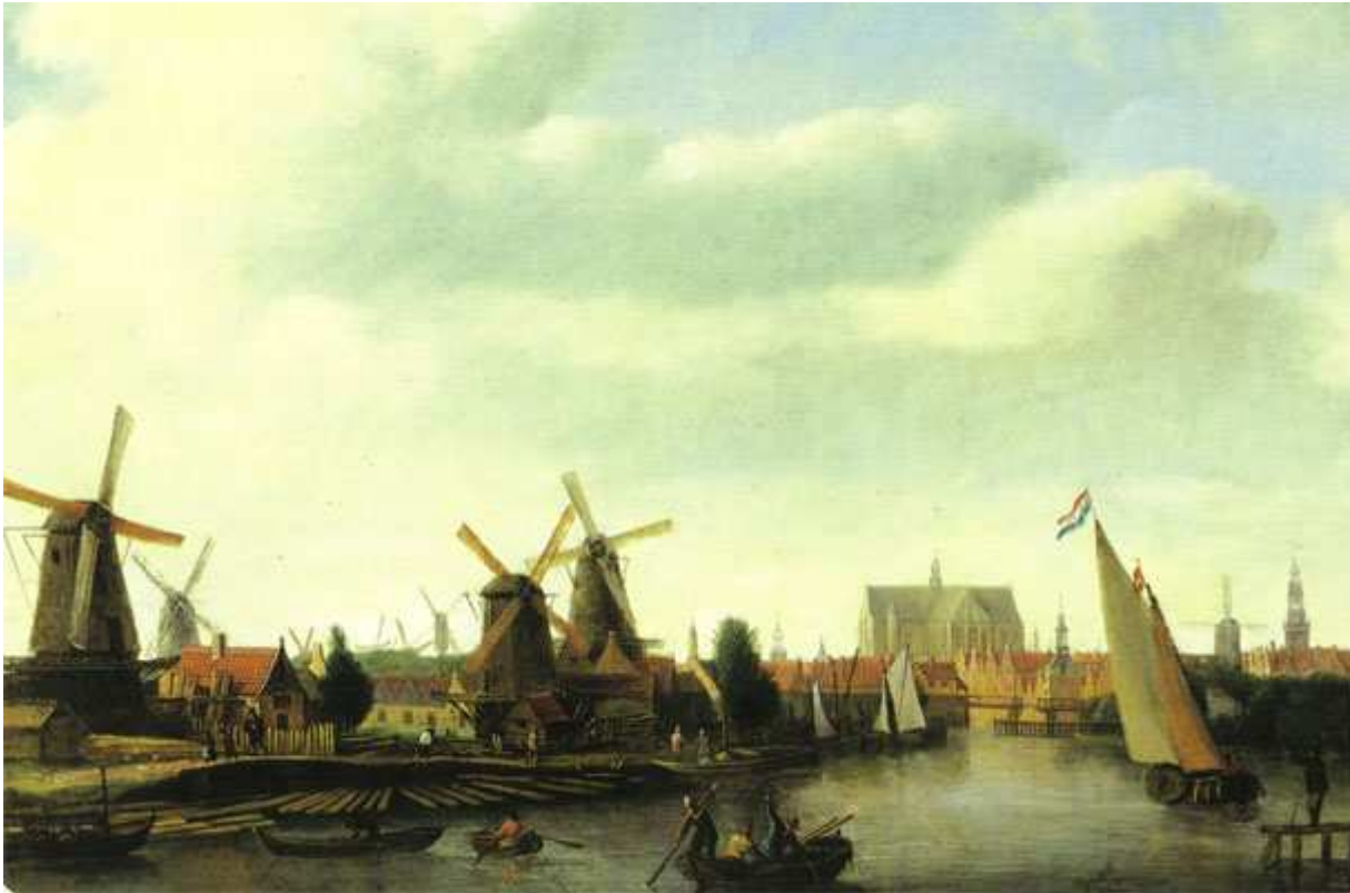
bron 15 gezicht op Alkmaar vanaf het Zeglis. Schilderij gemaakt omstreeks 1700.

Vóór de Industriële Revolutie waren turf en hout de belangrijkste brandstoffen. In Holland was er nóg een goedkope energiebron voorhanden: wind! De wind liet water- en industriemolens draaien, een uitvinding waarmee Holland eeuwenlang voorop liep. De molens hielden de polders droog, maalden graan en mout voor de bakkers en brouwers, ze zaagden hout of werden gebruikt voor het maken van verfstoffen, mosterd en papier. In de tijd van de industrialisatie werden steenkool en ijzererts de belangrijkste energiebronnen. In Holland waren die bronnen niet voorradig. Wie op stoomkracht wilde omschakelen moest de grondstoffen van ver halen en maakte dus hoge kosten – terwijl wind altijd gratis was. In nogal wat bedrijfstakken werd die omschakeling naar stoomkracht dus zo lang mogelijk uitgesteld. Je zou dus kunnen zeggen: de molens die Holland ooit hielden zijn economische voorsprong op te bouwen, droegen bij aan de economische achterstand waarmee Holland aan de 20e eeuw begon. Ook in en rond Alkmaar bleven tientallen windmolens draaien. De meesten maakten pas tegen het einde van de 19e eeuw plaats voor de eerste fabrieksschoorstenen.