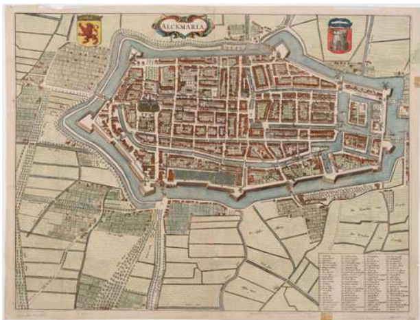
bron 1 Alkmaar voor de aanleg van het Noord-Hollands Kanaal

Honderd jaar later – omstreeks 1900 – heb je het heel wat gemakkelijker. Met het Noord-Hollands Kanaal, de Kennemerstraatweg, het spoor en de tram zijn er nieuwe, snellere verbindingen met de steden en dorpen in de omgeving en de wereld daarbuiten. De stoomtrein brengt je in een uur naar Amsterdam. Het lijkt wel een wonder!